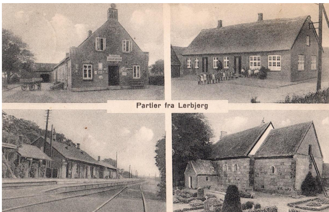
Partier fra Lerbjerg